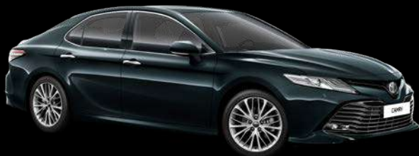
221 Қара түсті зүбәржат*