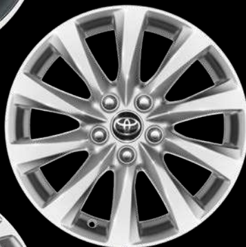
17" дискілер (10 шабақ) «Престиж» жиынтығы үшін