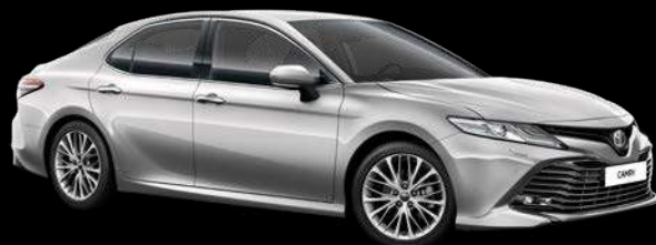
1F7 Күміс түстес*