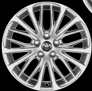
18" дискілер (20 шабақ) «Престиж Плюс», «Люкс» және «Люкс» (3,5 л) жиынтықтары үшін