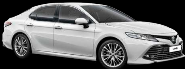
089 Ақ маржан түсті*