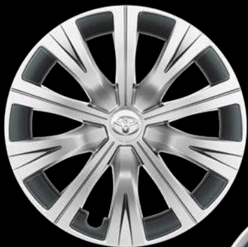
16" дискілер (10 шабақ) «Стандарт», «Классик», «Классик Плюс», «Комфорт» және «Элеганс» жиынтықтары үшін