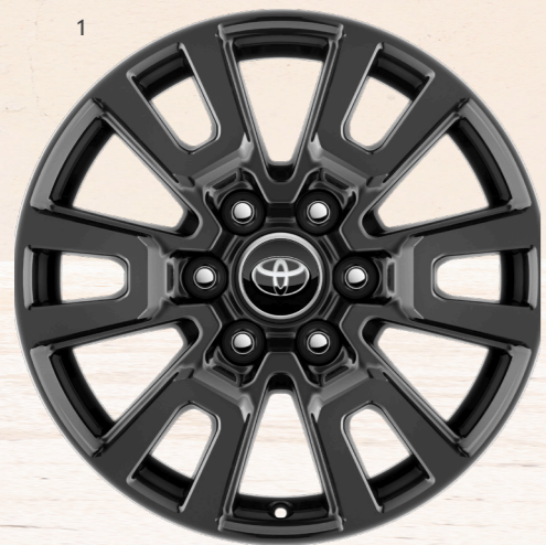
1. 18 дюймдік қою сұр түсті металл жеңіл қорытпалы дискілер (6 қос шабақты) Комфорт/Комфорт + жинақтамасы үшін стандартты жабдықталу