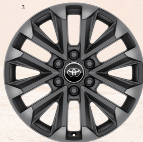
3. 20 дюймдік күңгірт қара түсті, беті өңделген жеңіл қорытпалы дискілер (6 шабақты) Люкс /Люкс+ жинақтамасы үшін стандартты жабдықталу