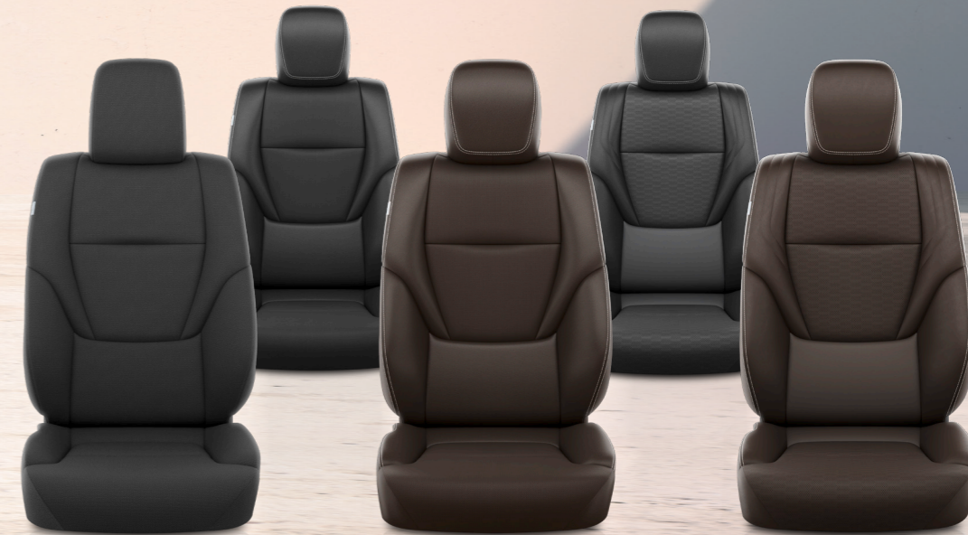
Интерьерді үшін былғарыдан, жасанды былғарыдан және матадан жасалған қара және Қою каштан түстеріндегі опциялар бар