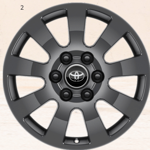
2. 18 дюймдік күңгірт сұр түсті жеңіл қорытпалы дискілер (9 шабақты) Престиж жинақтамасы үшін стандартты жабдықталу